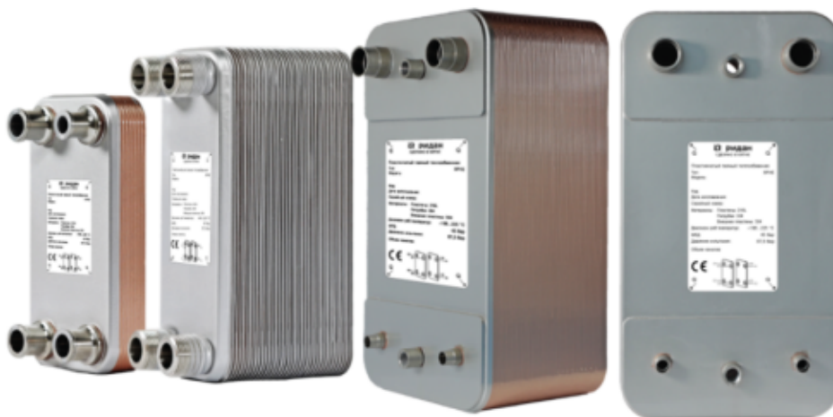
Рис.1 - Внешний вид теплообменников пластинчатых типа ВРНЕ

Теплообменники пластинчатые типа ВРНЕ предназначены для передачи тепловой энергии от одного теплоносителя к другому. Теплообменники пластинчатые типа ВРНЕ могут применяться в холодильных установках (компрессорных, абсорбционных), а также в тепловых насосах. В качестве рабочих сред могут использоваться с ГХФУ, ХФУ, ГФУ, ГФО и природные хладагенты не вступающие в реакцию с медью, технические и холодильные масла, вода для технических нужд и систем ГВС, спиртосодержащие растворы, водные растворы гликолей.